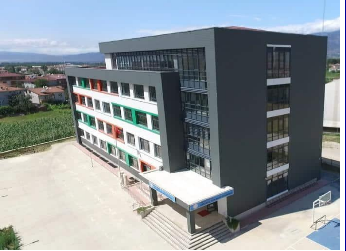
Resim 1. Okulumuz Binası

Milli Eğitim Bakanlığının 22.07.2019 tarih ve 13825463 sayılı oluruyla ; 15 Temmuz İmam Hatip Ortaokulu olarak açılan okulumuz,Eylül 2019 tarihinden itibaren eğitim öğretim faaliyetlerine başlanmıştır.Halen mevcut binamızda eğitim-öğretim faaliyetlerimiz devam etmektedir.Fiziki olarak eğitim- öğretim yönünden her türlü ihtiyaca cevap verecek şekilde inşa edilen mevcut okulumuz binası, modern bir eğitim ve yaşam alanı olarak tasarlanmıştır.